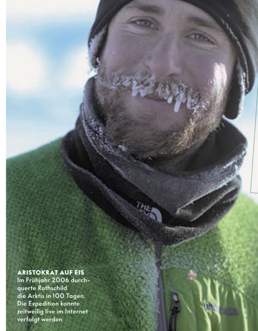
ARISTOKRAT AUF EIS Im Frühjahr 2006 durchquerte Rothschild die Arktis in 100 Tagen. Die Expedition konnte zeitweilig live im Internet verfolgt werden

Dass er selbst in die Politik geht, sei „eher unwahrscheinlich“. Zumindest die klassische Parteikarriere schließt er aus. Ein Rothschild ist auch so bestens vernetzt. Auf die Frage, ob David