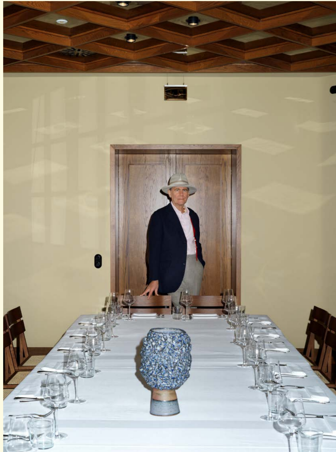
Sakko - JAMES WHITFIELD BESPOKE Hemd - PURWIN & RADCZUN Hose - JAMES WHITFIELD BESPOKE Hut - FIONA BENNETT Kunst - KL KERAMIK