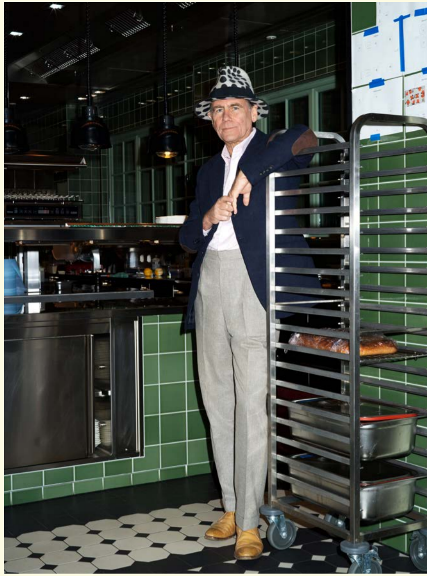
Sakko - JAMES WHITFIELD BESPOKE Hemd - PURWIN & RADCZUN Hose - JAMES WHITFIELD BESPOKE Hut - FIONA BENNETT Schuhe - CROCKETT & JONES