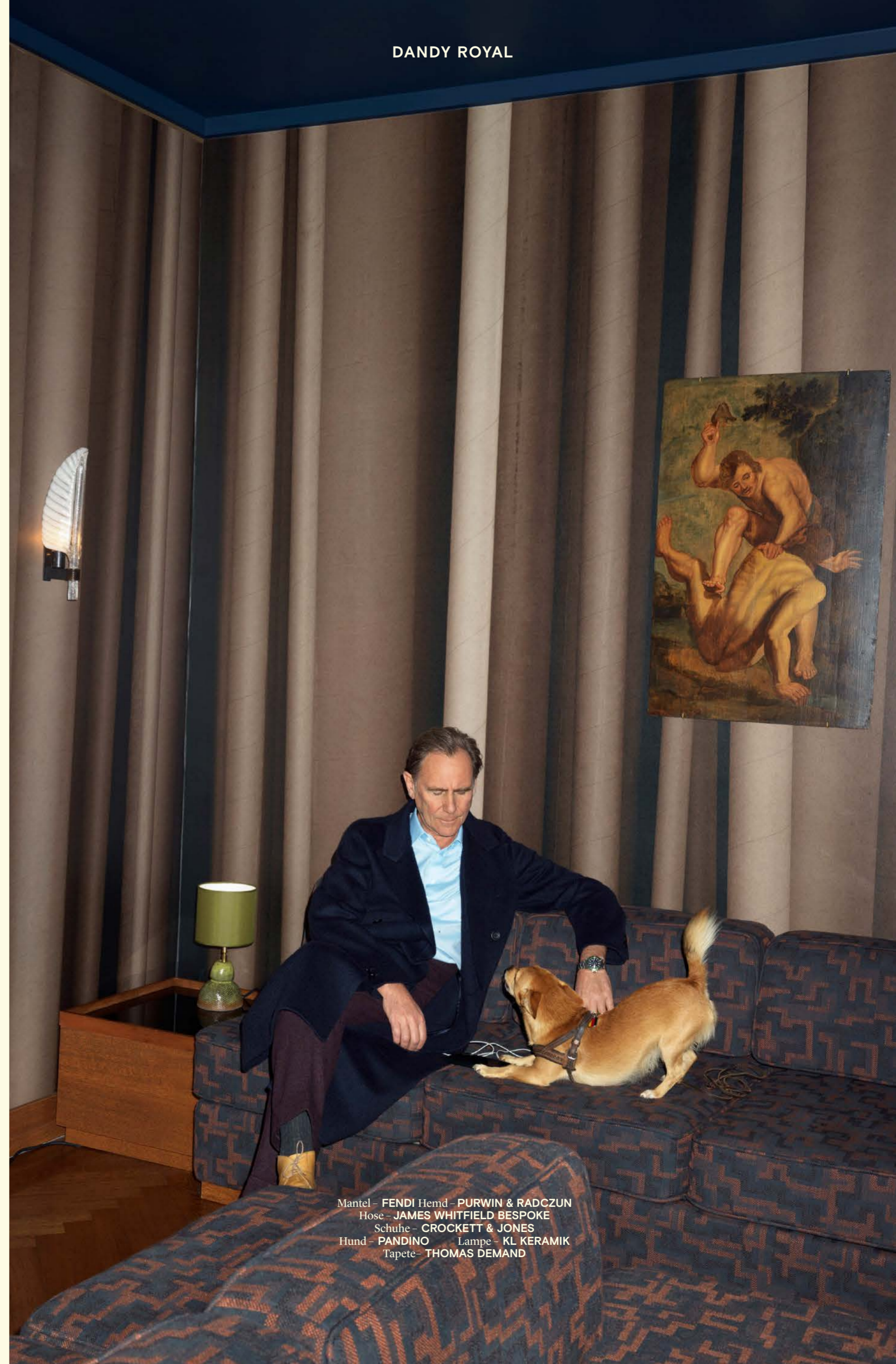
Mantel - FENDI Hemd - PURWIN & RADCZUN Hose - JAMES WHITFIELD BESPOKE Schuhe - CROCKETT & JONES Hund - PANDINO Lampe - KL KERAMIK Tapete - THOMAS DEMAND